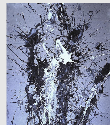
La Naissance de la Gravitation